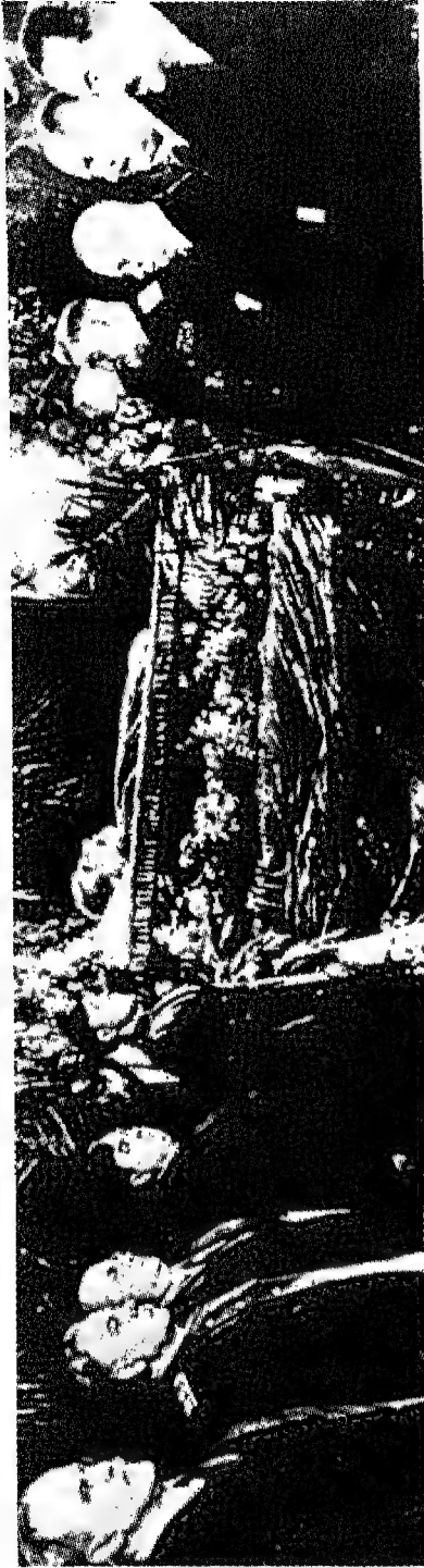
حول نعش ستالين في الكرملين: من اليسار: مولوتوف، فوروشيلوف، بيريا ومالينكوف من اليمين؛ بولغانين، خروتشوف، كاغانوفيتش